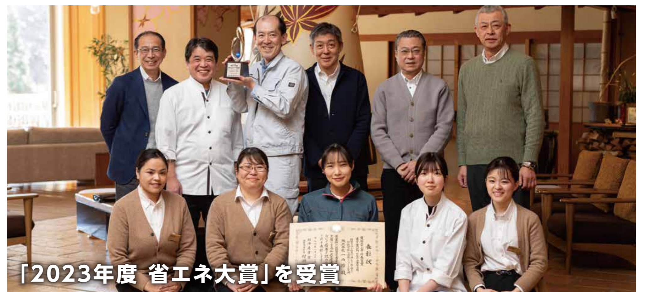
「2023年度 省エネ大賞」を受賞