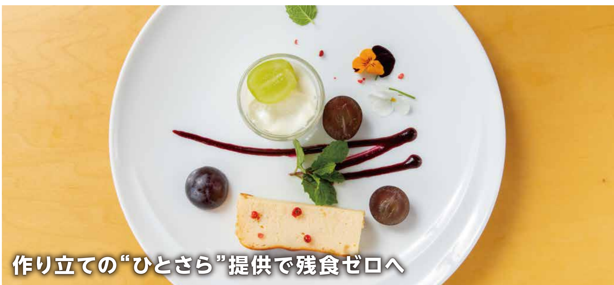
作り立ての“ひとさら”提供で残食ゼロへ