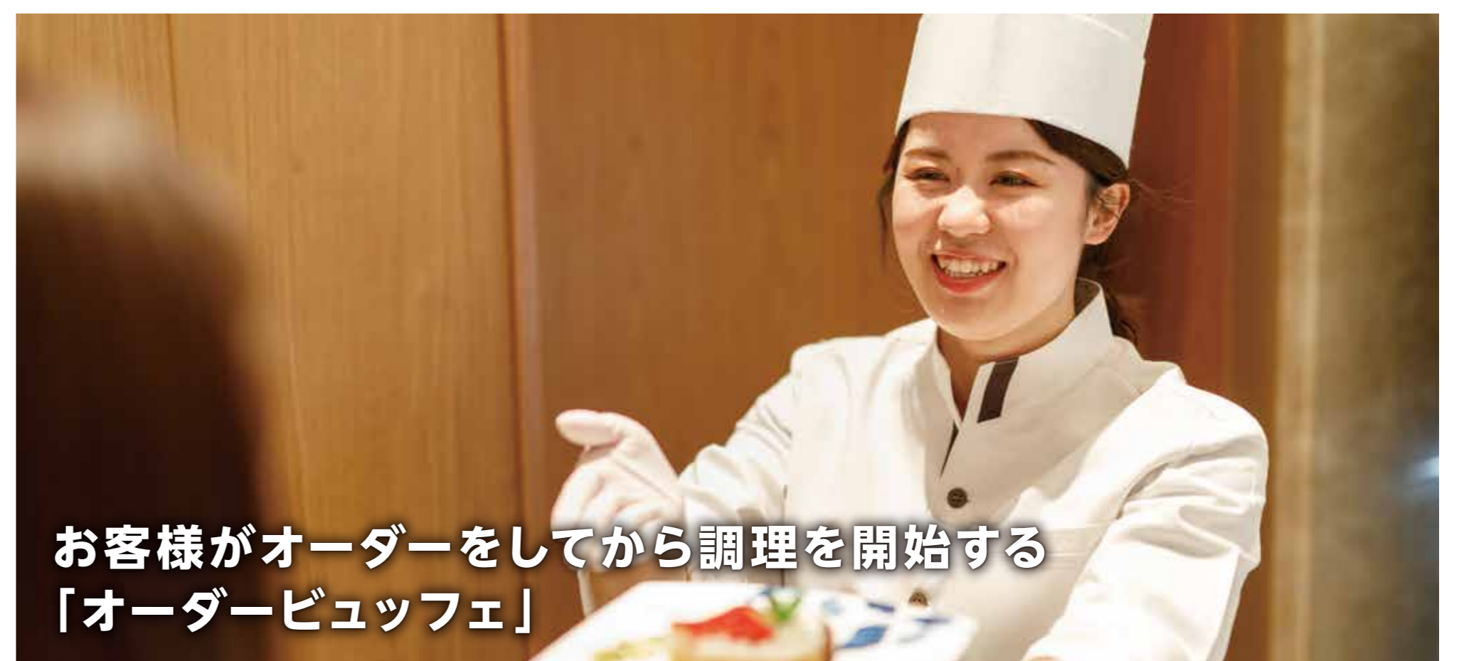
お客様がオーダーをしてから調理を開始する「オーダービュッフェ」