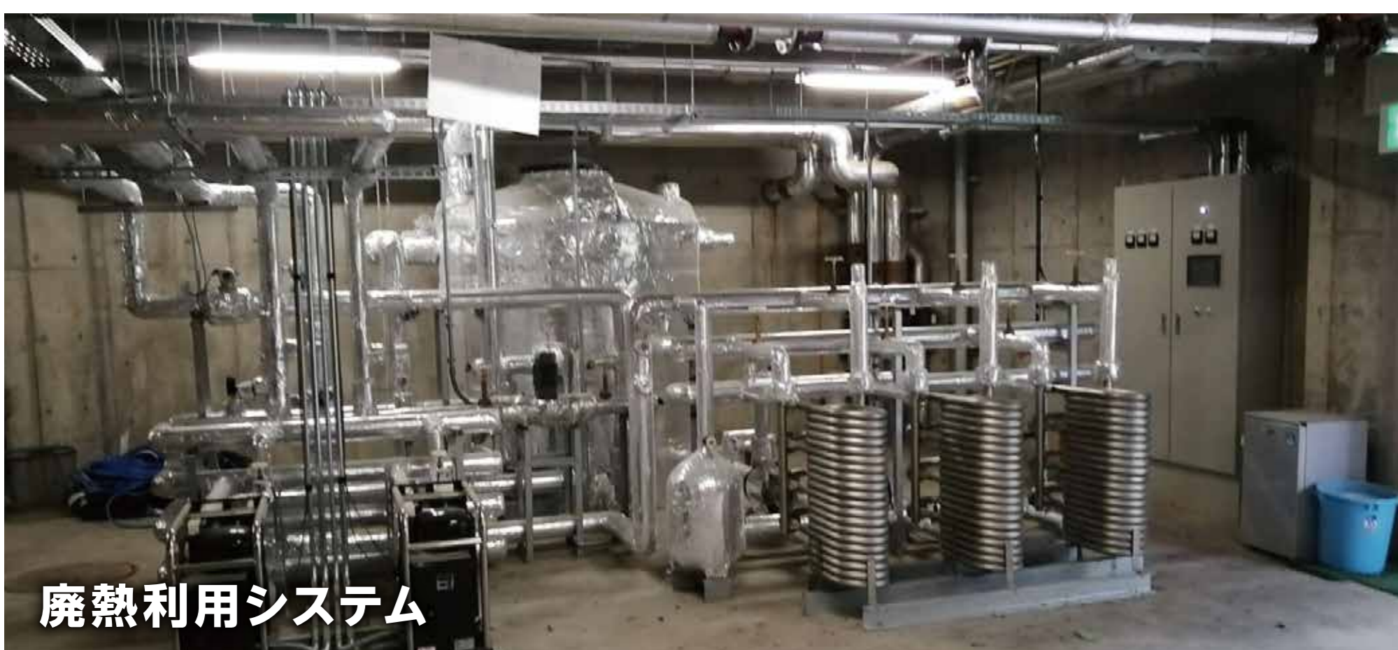
廃熱利用システム

二酸化炭素排出量などを定量化し進捗管理を実施するなど、全社一丸となってPDCAにより二酸化炭素排出削減に取り組むシステムを構築している。