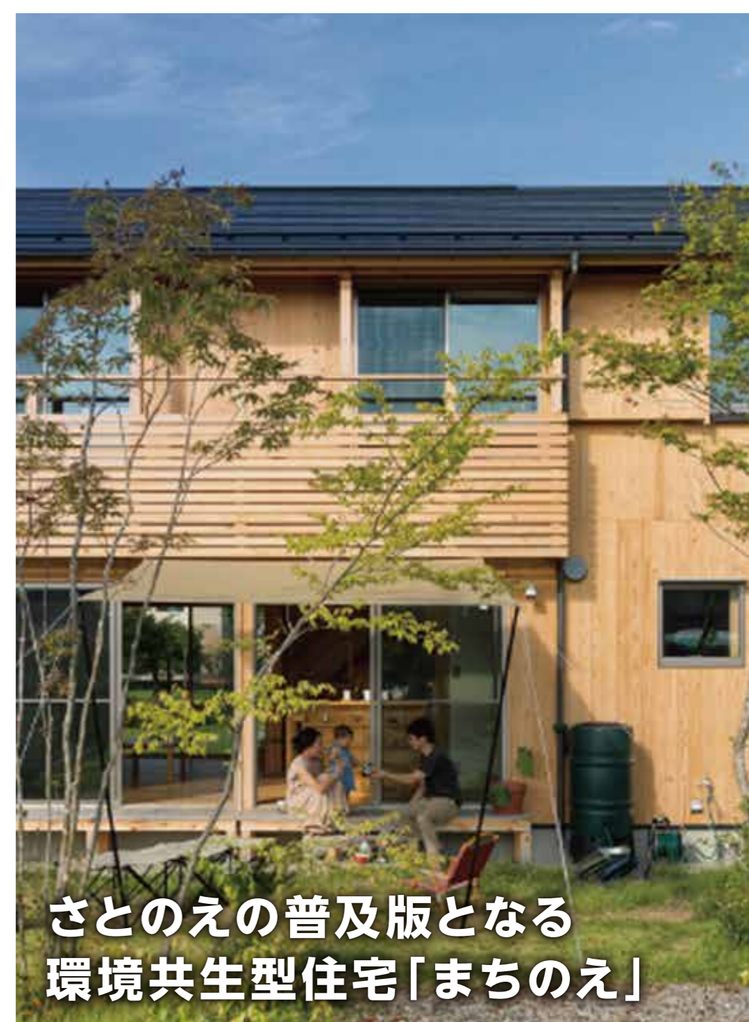
さとのえの普及版となる環境共生型住宅「まちのえ」