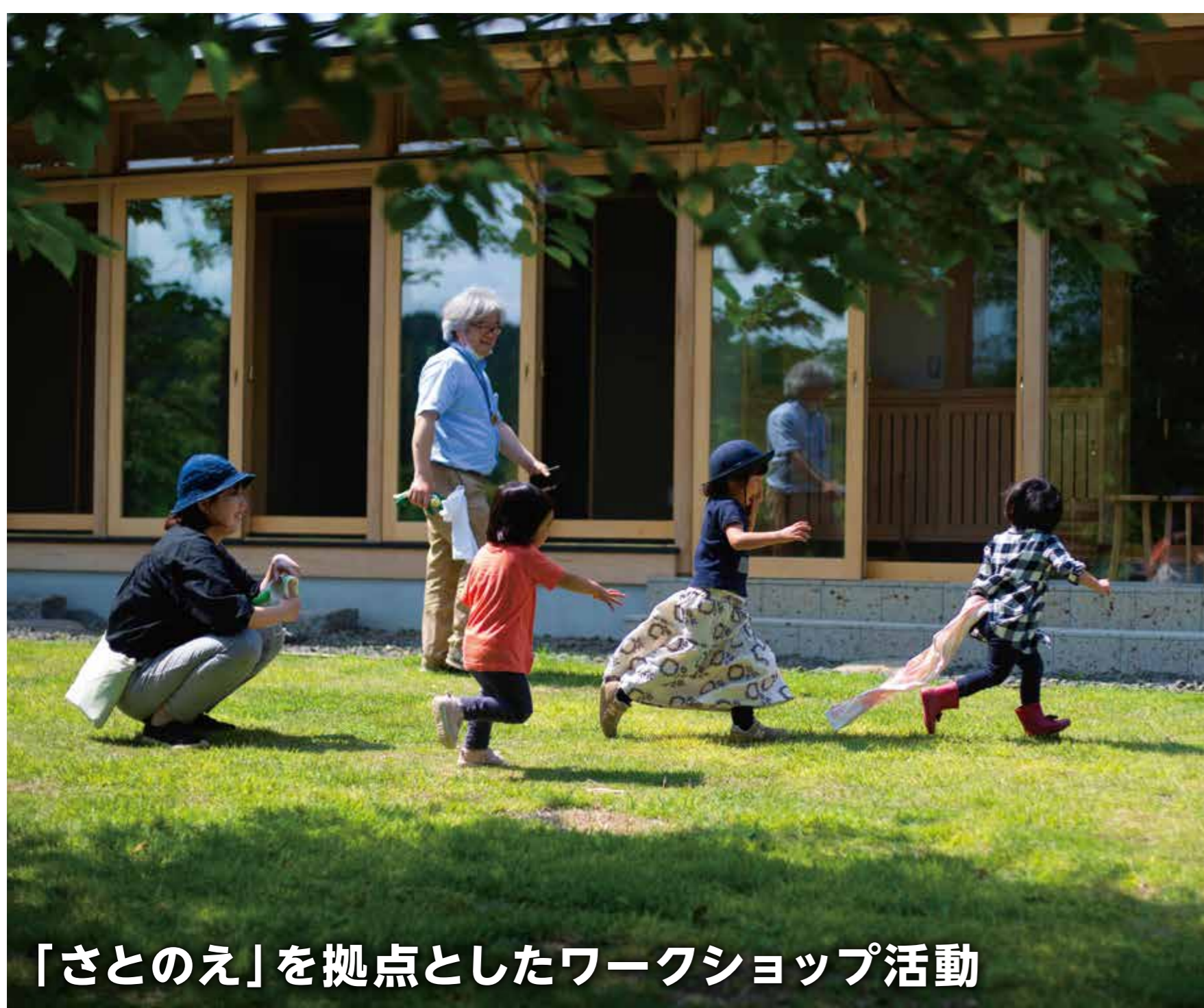
「さとのえ」を拠点としたワークショップ活動

自社で植林から建築、メンテナンスまで一貫して実施するなど、森林保全・県産材利用に積極的に取り組むほか、「自然・地域との共生」を理念に掲げた、高いエネルギー自給率を有するモデルハウス「さとのえ」を建築・公開。地域の団体と連携し、エネルギーの地産地消の実践と普及啓発に取り組んでいる。