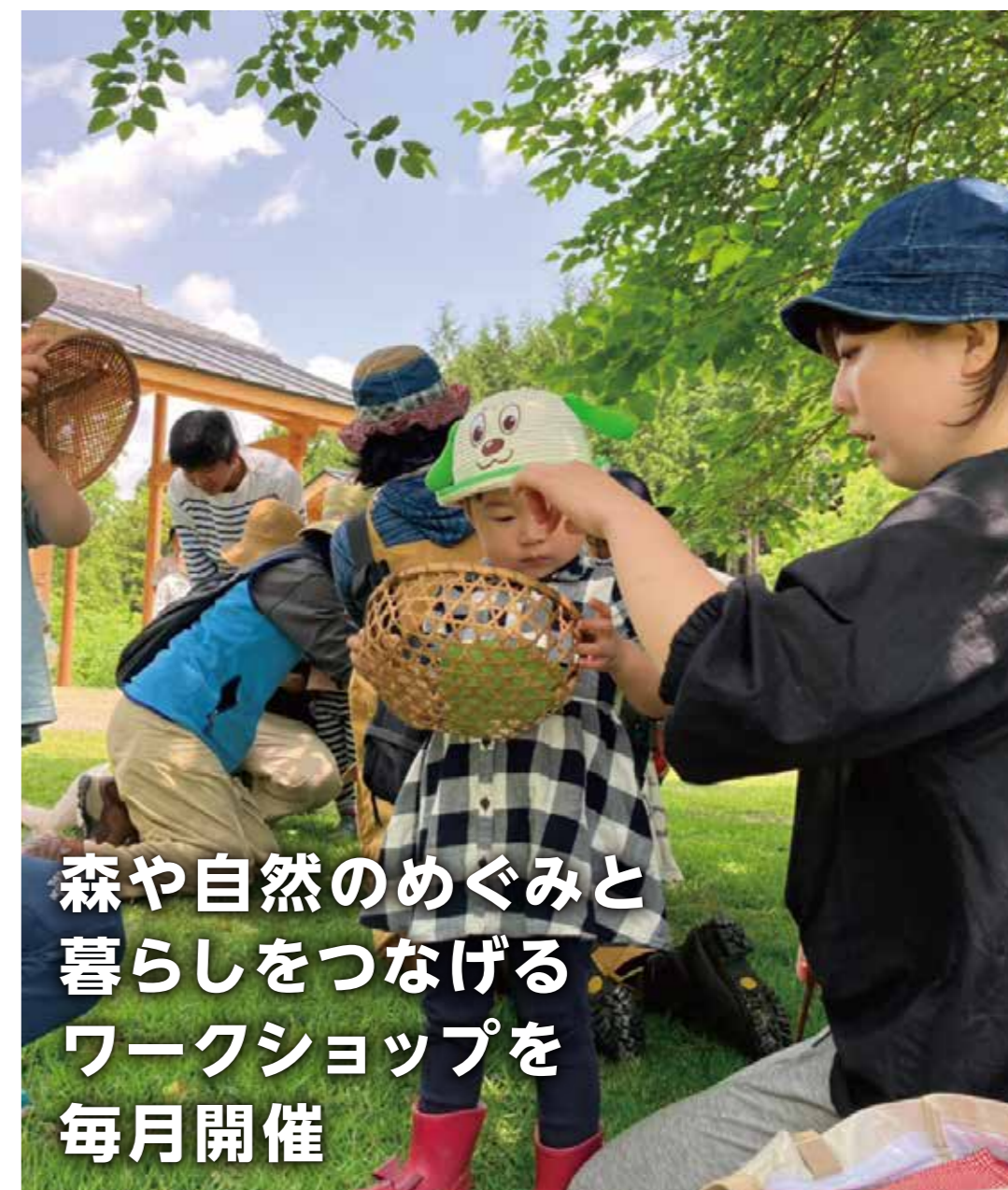
森や自然のめぐみと暮らしをつなげるワークショップを毎月開催