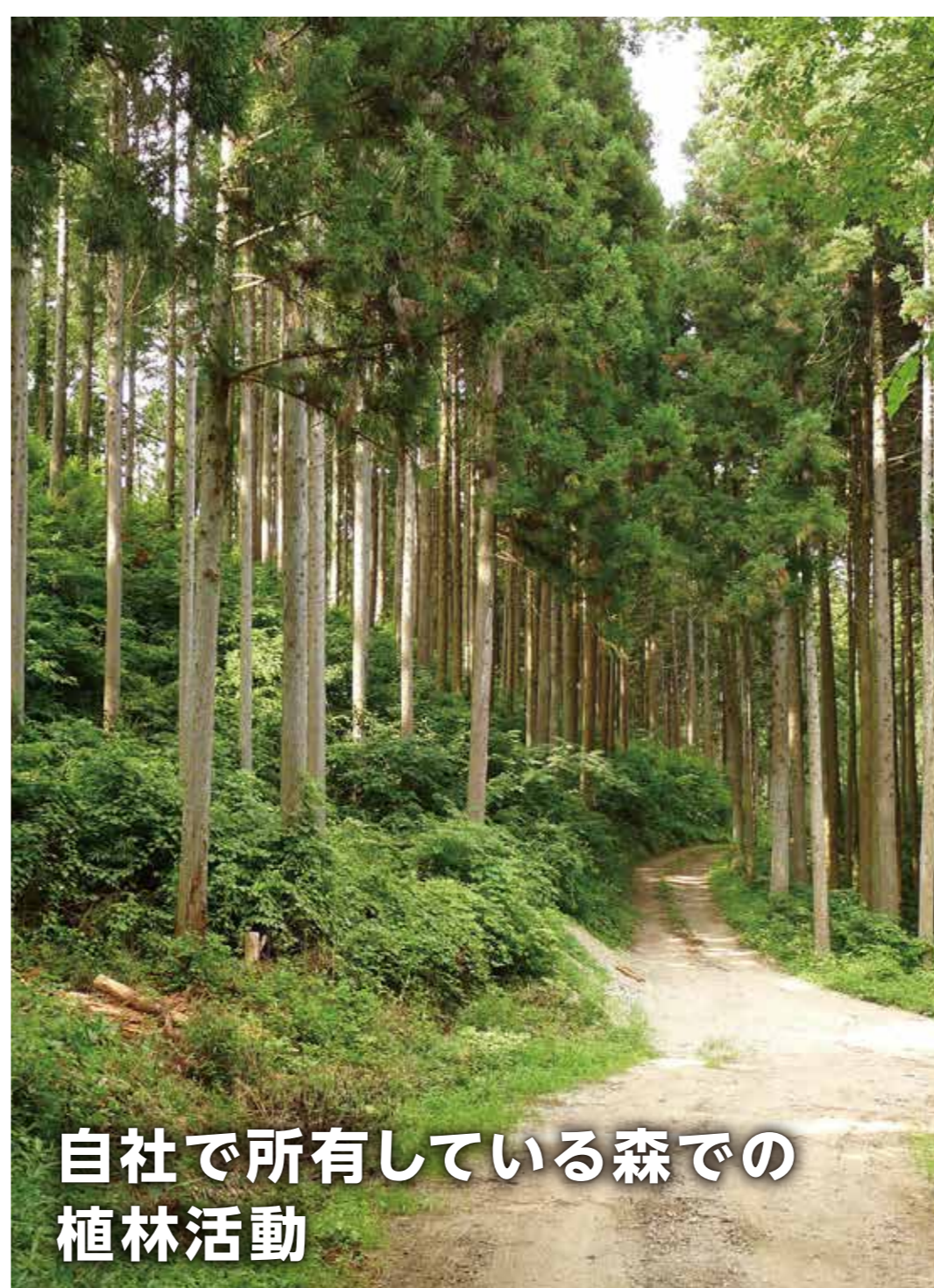
自社で所有している森での植林活動