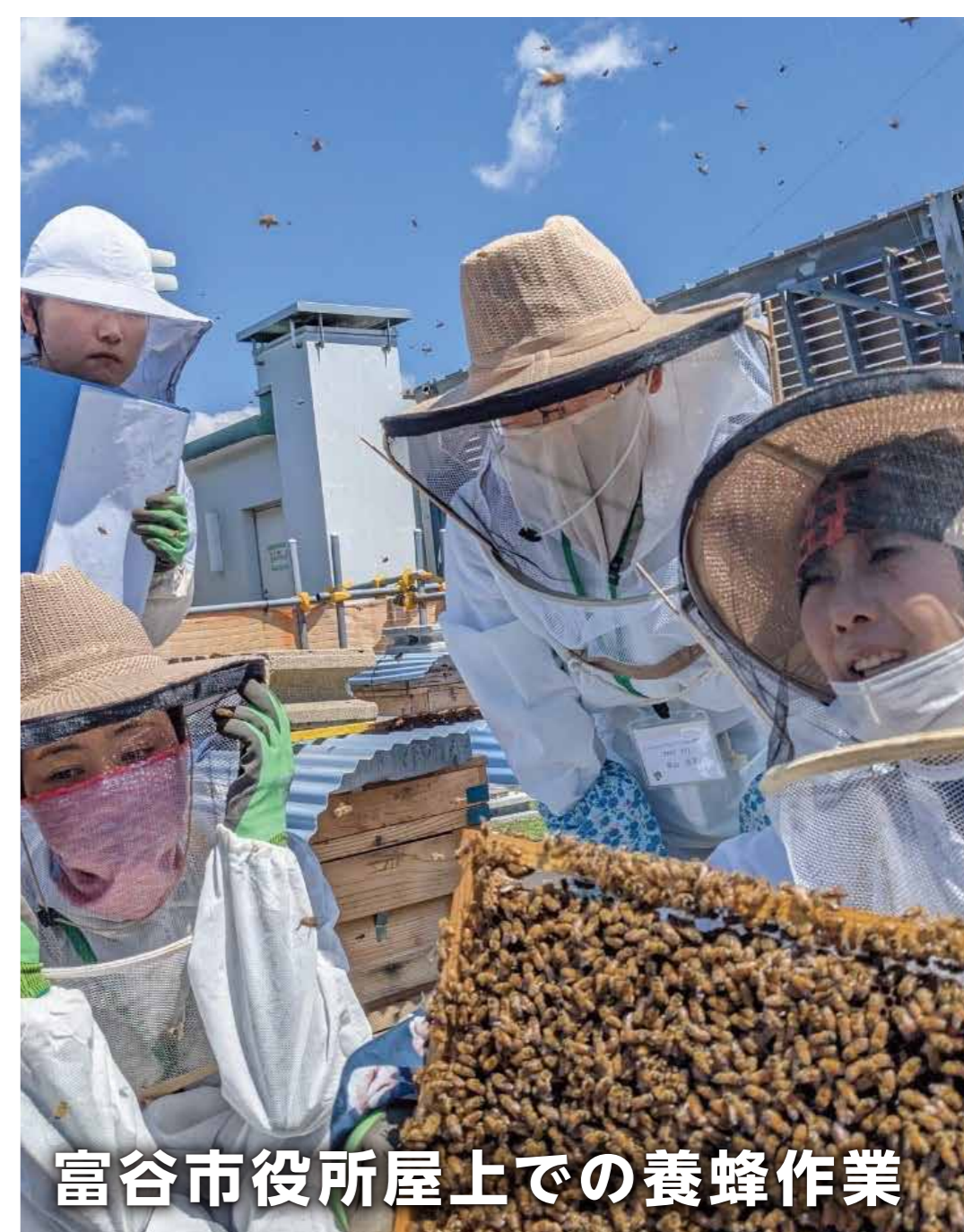
富谷市役所屋上での養蜂作業