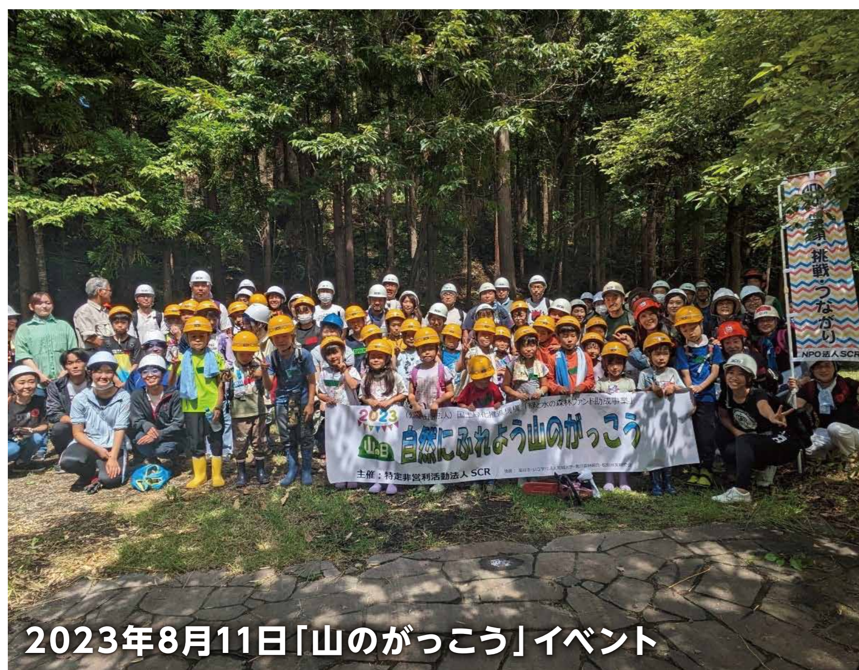
2023年8月11日「山のがっこう」イベント

「とみやはちみつプロジェクト」により環境指標生物であるミツバチの養蜂に市民参加型で取り組むほか、市内小学校においてミツバチをテーマとした出前講座を継続的に開催するなど、子どもを中心に環境保全の重要性を伝えている。このほか、自治体や大学と連携した森林保全イベントや、地元食材とはちみつを活用した地産地消に関するワークショップを開催するなど、木育・食育にも取り組んでいる。