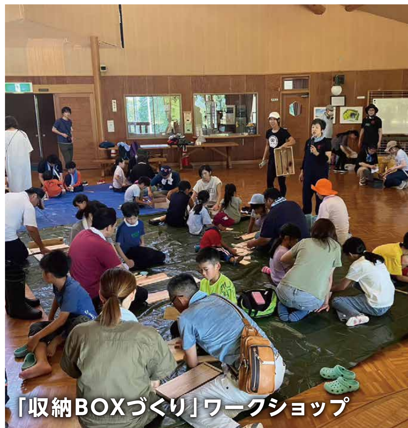
「収納BOXづくり」ワークショップ