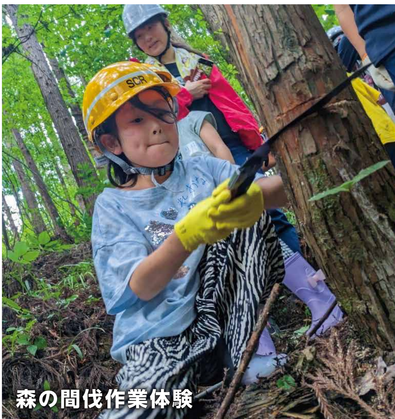
森の間伐作業体験